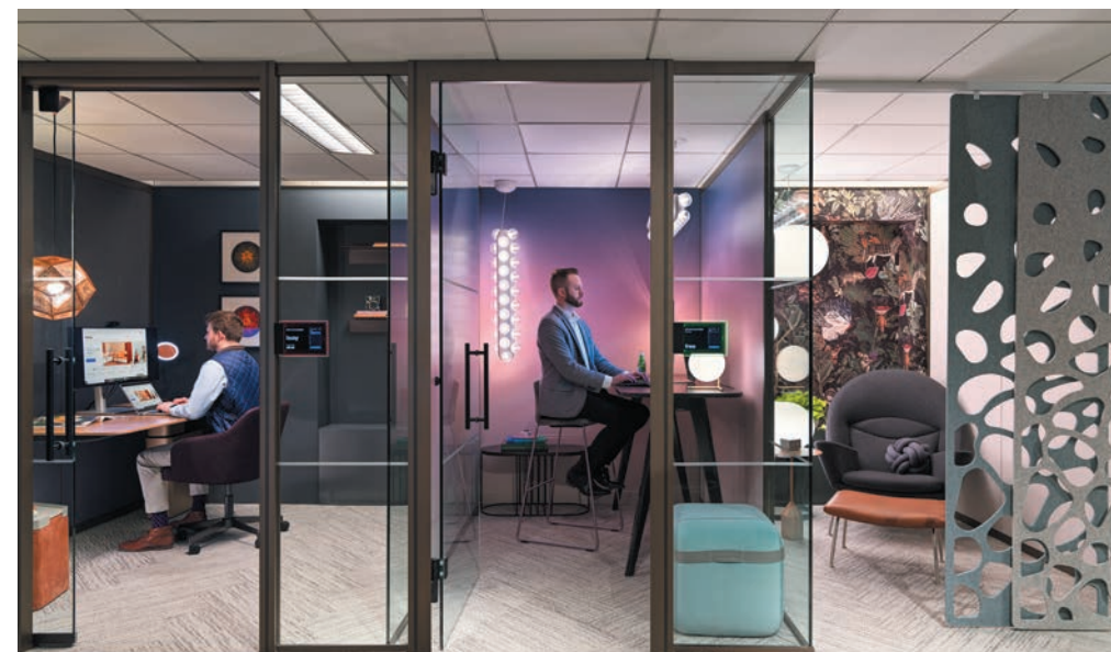
Steelcase New York

Das Thema Privatsphäre hat im Laufe der Pandemie weiter an Wichtigkeit gewonnen. Die Angestellten hatten schon zuvor ihre Schwierigkeiten mit sehr offenen Arbeitsumgebungen. Jetzt, nach der Phase, in der sie nur von zu Hause aus gearbeitet haben, ist das Bedürfnis, auf ihre Privatsphäre Einfluss zu nehmen, noch stärker geworden. Gute Stadtviertel bieten private und öffentliche Bereiche, weshalb sie vielfältig und dynamisch sind.